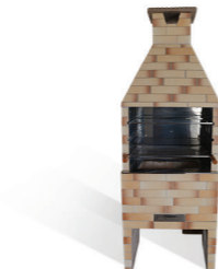
Churrasqueira revestida mesclada com revestimento esmaltado