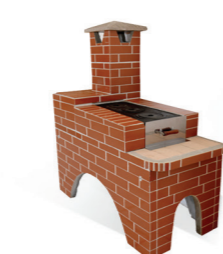
Fogão caipira revestido