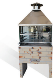
Churrasqueira revestida com vidro e coifa de inox