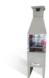
Churrasqueira natural sem revestimento