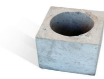
Adaptador de concreto 30x25 para tubo de inox n° 9