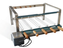
Gira gril com suporte: com 3 a 5 espetos