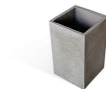
Duto de concreto natural 30x50 para chaminé da churrasqueira