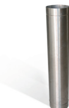
Tubo de inox ou galvanizado n° 5 e n° 9 (comprimento: 1000mm)