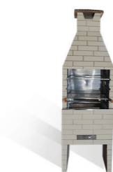
Churrasqueira revestida branca com revestimento esmaltado