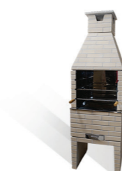
Churrasqueira branca com revestimento branco Fosco