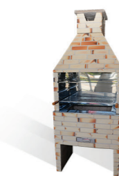
Churrasqueira revestida mesclada com revestimento fosco