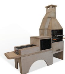
Fogão com forno acoplado com churrasqueira