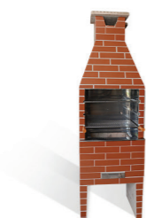
Churrasqueira revestida vermelha com revestimento esmaltado