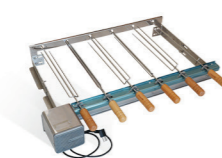
Gira gril sem suporte: com 4 a 6 espetos