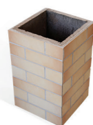
Duto de concreto revestido 30x50 para chaminé da churrasqueira