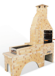
Fogão sem forno acoplado com churrasqueira